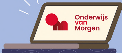
Onbeperkt toegang tot onderwijsvanmorgen.nl voor al je inspiratie!