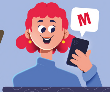
Supergoede ondersteuning van klantenservice en accountmanager

MALMBERG staat altijd voor je klaar. Heb je vragen of wil je een methode uitproberen?