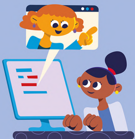
Training en coaching