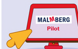
3 maanden pilot