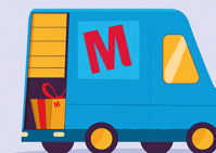
Bestel een beoordelingspakket