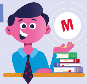
Advies van accountmanager