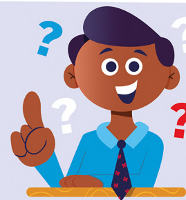
Q&A met de methodespecialist